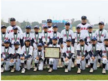
第3位 千葉県代表 「印旛ブラザーズ」