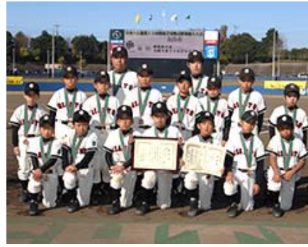
第三位「大間々東小リトルジャイアンツ」