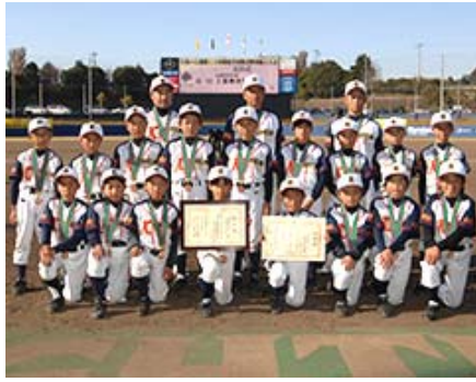
第三位「上暮地少年野球」