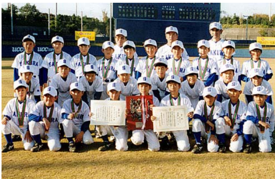
準優勝の栃木県代表の桜学童のみなさん